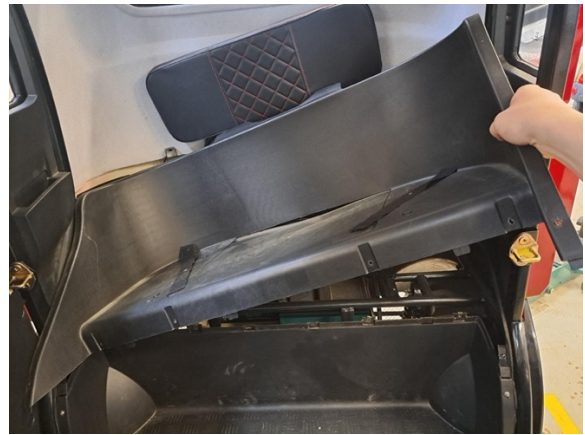
Nosta takaistuimen runko osa pois.