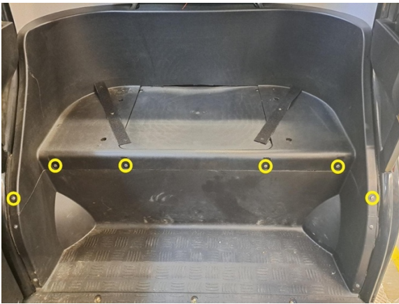
Irrota takaistuimen rungon kiinnitysruuvit. (ristipäämeisseli ph2).