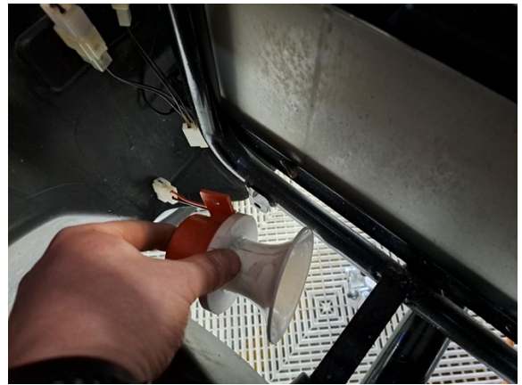
Ota peruutussummeri pois.

Uuden osan asennus käänteisessä järjestyksessä.