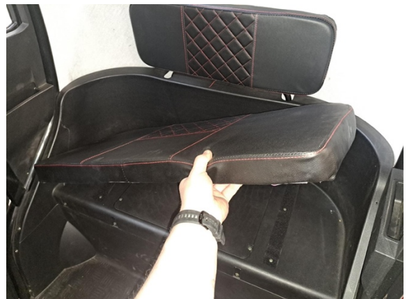
Nosta takaistuin pois. (tarrakiinnitys).